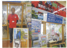
移住・定住総合相談窓口 (一般社団法人カガミノミライ)