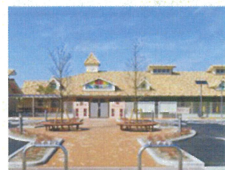
かがみの中央こども園