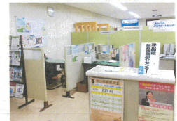
津山圏域無料職業紹介センター